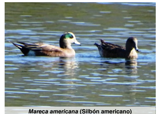
Mareca americana (Silbón americano)