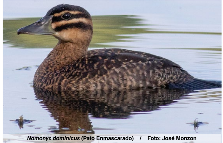
Nomonyx dominicus (Pato Enmascarado)

Hace 165 millones de años, un grupo de reptiles evolucionó hasta dar origen al grupo de las aves, desde sus inicios, muchas especies de este amplio grupo, colonizaron los humedales. Un alto porcentaje de las 9,000 especies de aves que actualmente habitan nuestro planeta viven asociadas al agua.