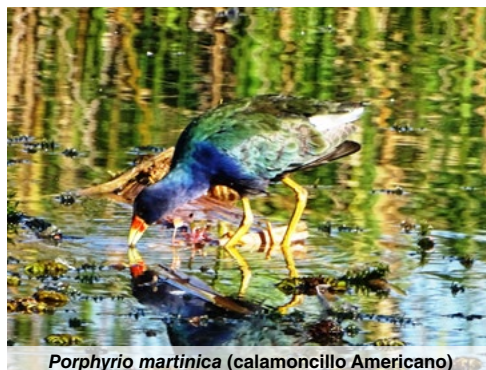
Porphyrio martinica (calamoncillo Americano)