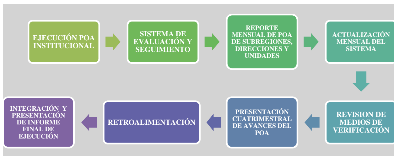
FIGURA 1: ESQUEMA DE LAS ETAPAS DEL SISTEMA DE EVALUACIÓN Y SEGUIMIENTO DEL POA INSTITUCIONAL.

El Sistema de Planificación, Seguimiento y Evaluación Institucional se basa en una estrecha coordinación con todos los órganos de la institución. El proceso de Seguimiento y Evaluación del POA, se ajusta a las siguientes etapas: